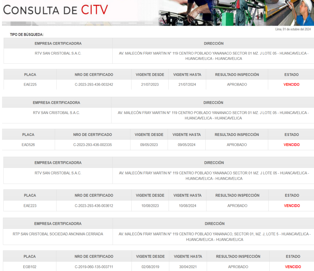
Imagen n.º 2 Consulta sobre situación de Certificado de Inspección Técnica Vehicular (CITV) de los vehículos