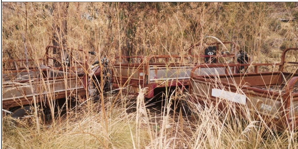
Imágenes n.º 10, 11 y 12: Motos cargueras inoperativas en estado de abandono en las instalaciones del campamento Santa Rosa, las cuales se encuentran a la intemperie con los accesorios y carrocería oxidada por exposición a la lluvia, con hierba crecida a sus alrededores; situación que coadyuban a su continuo deterioro, y consecuentemente al menoscabo de su valor económico.