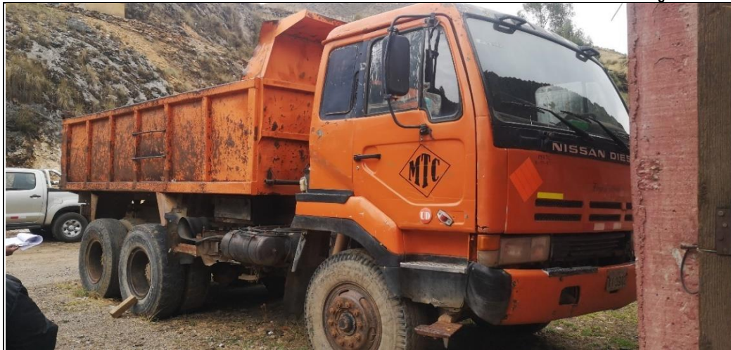
Imágenes n.º 13 y 14: Camión volquete inoperativo en estado de abandono, cuya placa anterior fue XI-3902 y la placa actual es EGM-042, al igual que todos los vehículos mostrados en este panel de fotográfico, se encuentra a la intemperie en las instalaciones del campamento Santa Rosa.