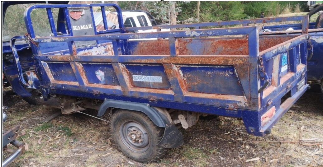
Imagen n.º 9: Vehículo motorizado tipo moto carguero de placa de rodaje EB 9243, se encuentra a la intemperie con los accesorios y carrocería oxidada, estado inoperativo y abandonado.