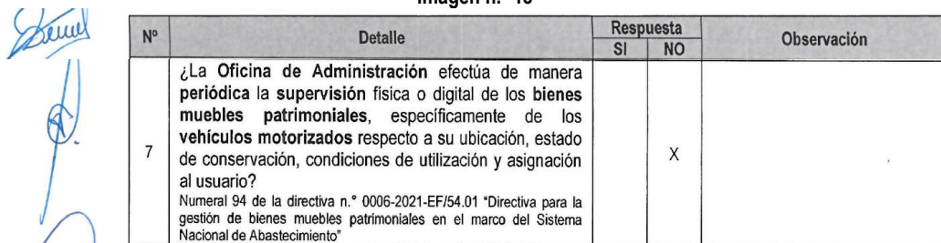
Imagen n.º 18