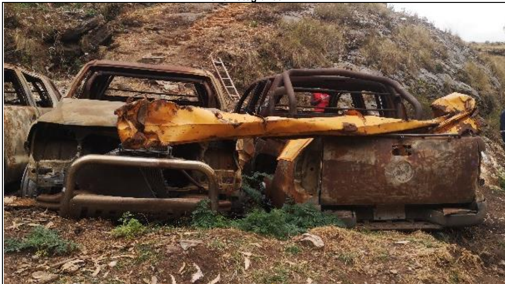
Panel fotográfico n.º 2

Sin embargo, la comisión de control en la Visita de Control efectuada el 27 de setiembre de 2024, identificó que los citados vehículos dados de baja, descritos en el cuadro n.º 6, continúan siendo custodiados por la Entidad, los cuales se encuentran en el campamento Santa Rosa, junto a los demás vehículos motorizados administrados por la Entidad, tal como se puede apreciar en el panel fotográfico siguiente: