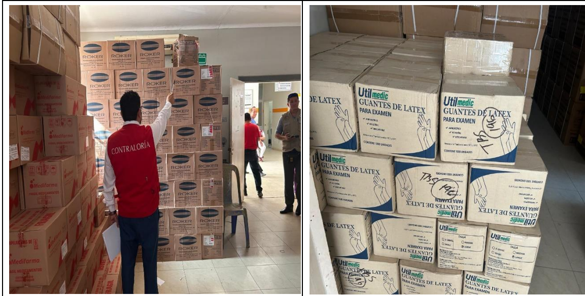
Se evidencia cajas de insumos y/o materiales médicos empilados sobre el suelo.