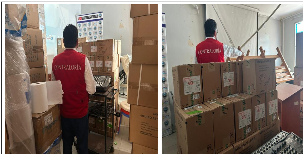
Se observa consola con su mesa en medio de los insumos y/o materiales médicos.