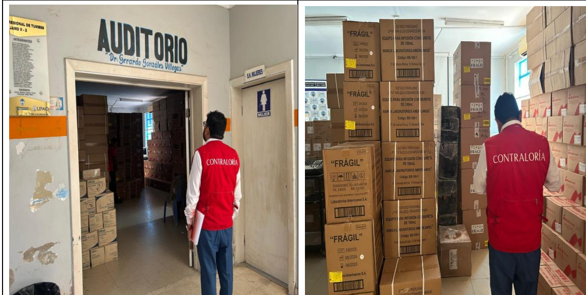
Ambiente (Auditorio) acondicionado como almacén de insumos y/o materiales médicos.