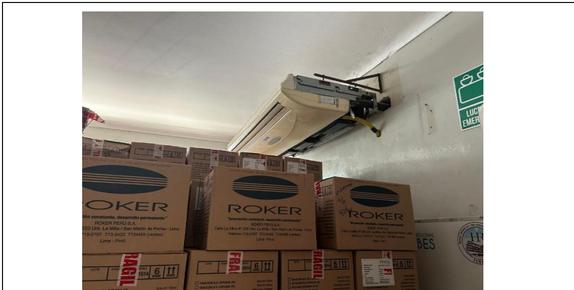
Se visualiza aire acondicionado inoperativo.